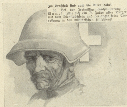
... hast noch der Söhne ja! Isler

Es ist furchtbar, wenn ein Redner immer wieder dasselbe sagt und es nicht weiß; schlimmer aber, wenn er es weiß. Rü.