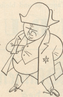
Napoleon einen Dreispitz