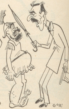
und N. Ch. einen — — ?