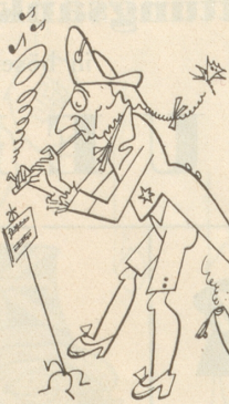
Der alte Fritz eine Flöte