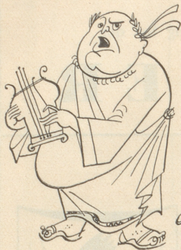
Nero hatte eine Harfe