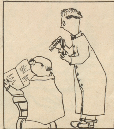
«Wüesed Sie als Fachmann eigentlich, wie-n-e Glatze z'stand chunt?» «O ja! durch Haarustfall!»