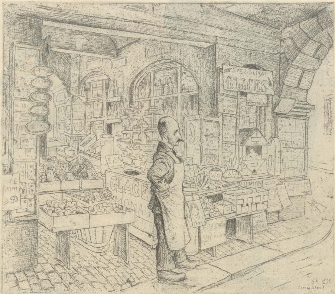
Stand am Limmatquai

Nach einer Radierung von G. Rabinovitch.