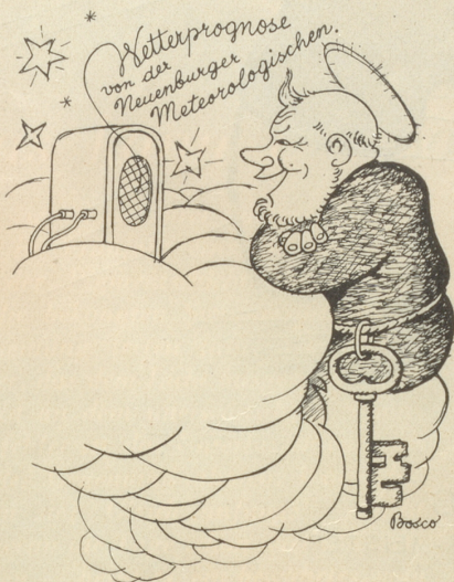
Petrus amüsiert sich!

schickt einer die Lösung des Nobelpreisrätsels per Air Mail. Wir sind alle gerührt. Dank.