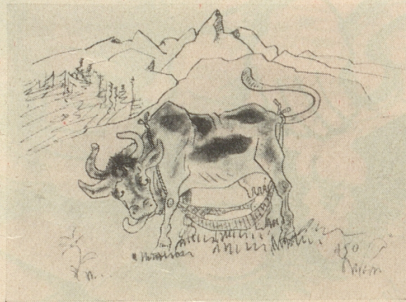
Vom Produzenten direkt zum Verbraucher.