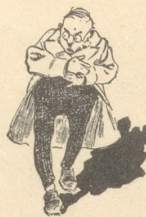
3) Stäche uitem Härz,