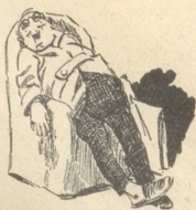
2) furchtbari Müedigkeit,