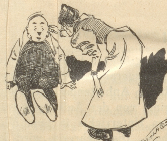
11) Stand uf, alte Löli — gang mer ändli go Chole hole!