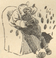
9) Fläcke vor de Auge,