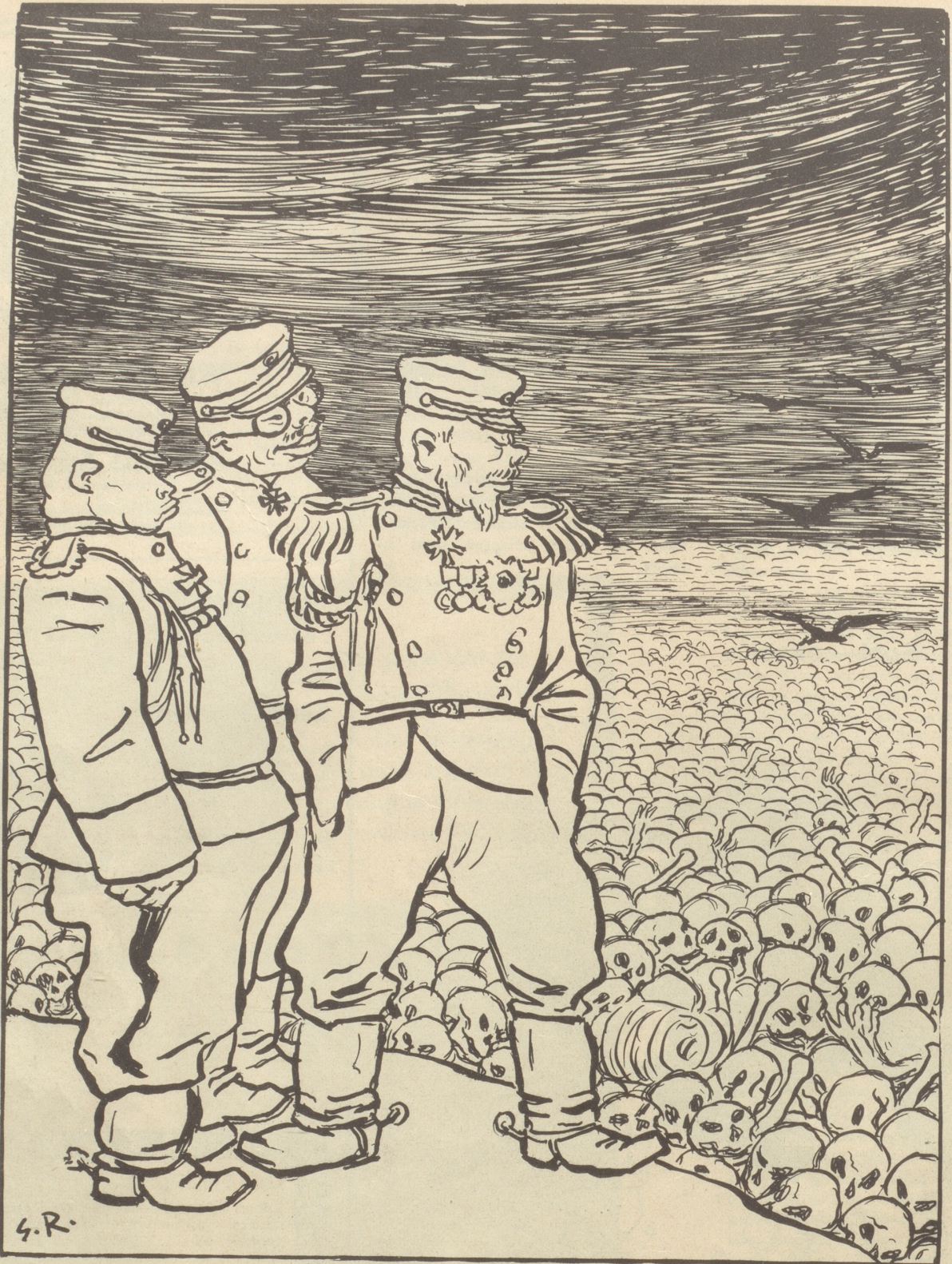
Der japanische Kriegsrat unterlässt die Kriegserklärung, um keinen schlechten Eindruck auf die Welt zu machen!