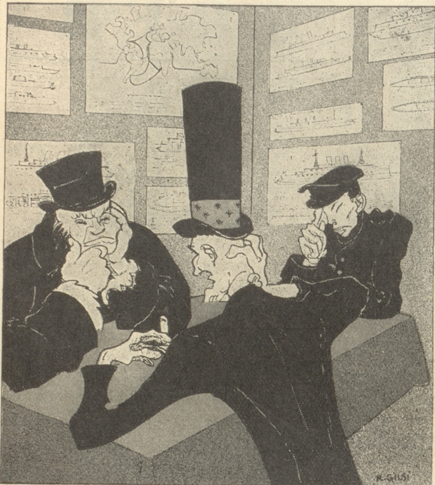
«Die Schwierigkeit der Aufgabe liegt darin, einen harmlos versöhnlichen Ausdruck für den Begriff Wettrüsten zu finden.»