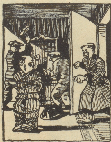
«Wenn der Lärm da oben nicht bald aufhört, dann ruf ich die Polizei!»

Unbegreiflicherweise verliebte sich Johannes Flottow, der Schürzenjäger, in diese Frau, und sogar Rosine konnte seiner Werbung nicht widerstehen. Leider wurde Flottow bitter enttäuscht, denn Rosine war gar nicht geizig, sondern hatte wirklich kein Geld. E. H.