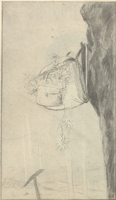
Die Polizei von Pontresina nahm zwei Personen fest, von denen die eine 350, die andere 330 Edelweiß, die meisten sogar mit den Wurzeln, ausgerissen hatte.

Passid uf, uf eimal blybt de Rucksack hange!