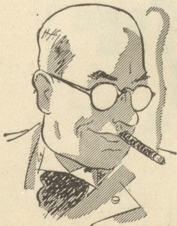
Wenn er im Mund den Stumpen hält, Kennt er genau den Lauf der Welt.