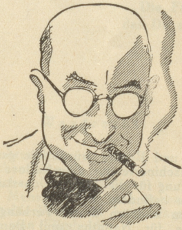
Doch nur ein Weber-Stumpfen! Klar! Dann schreibt er wirklich wunderbar!