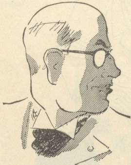
Es zeigt dies Bild hier einen Mann, Der Leitartikel schreiben kann.