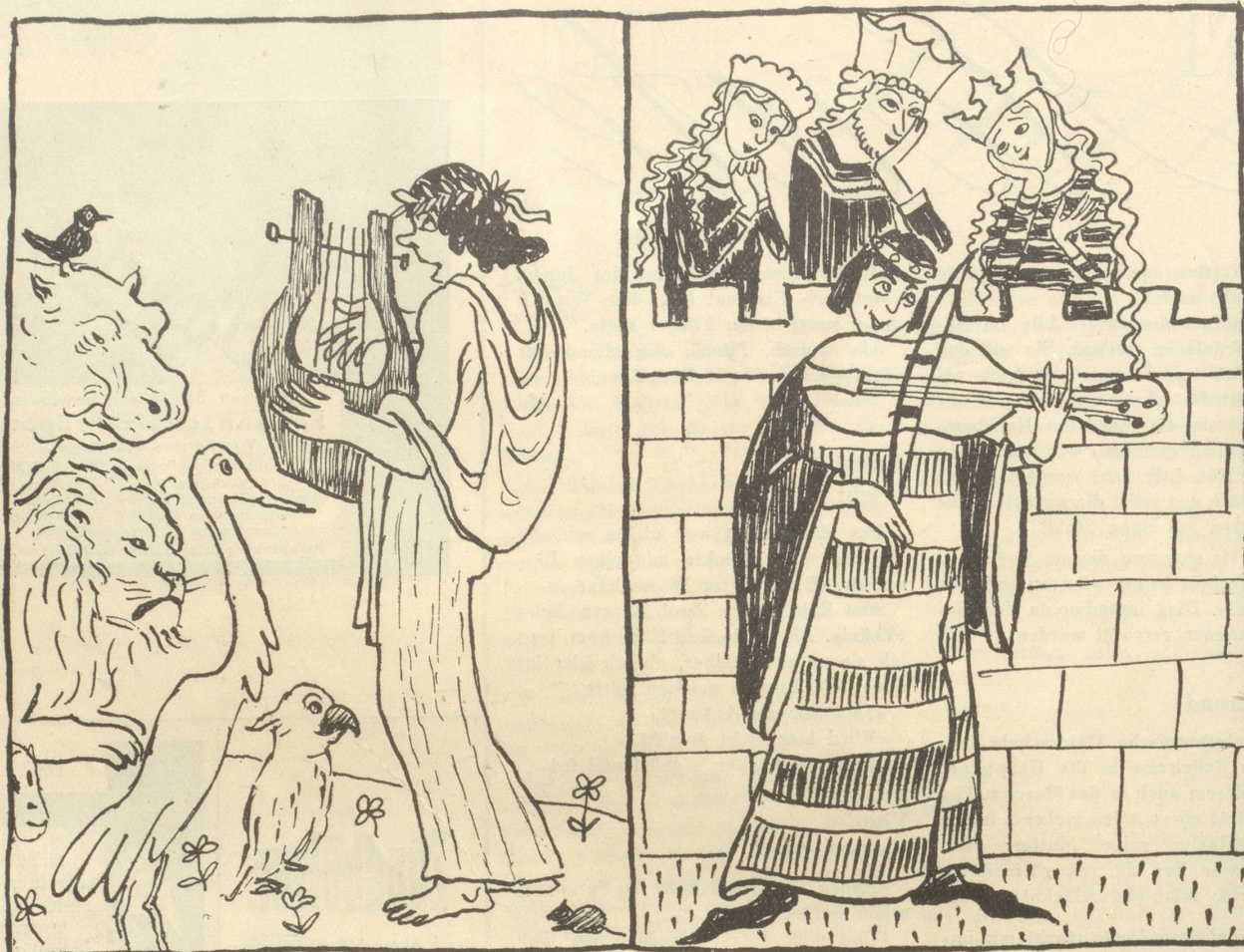
Orpheus zähmte mit seinem Gesang die wildesten Tiere,