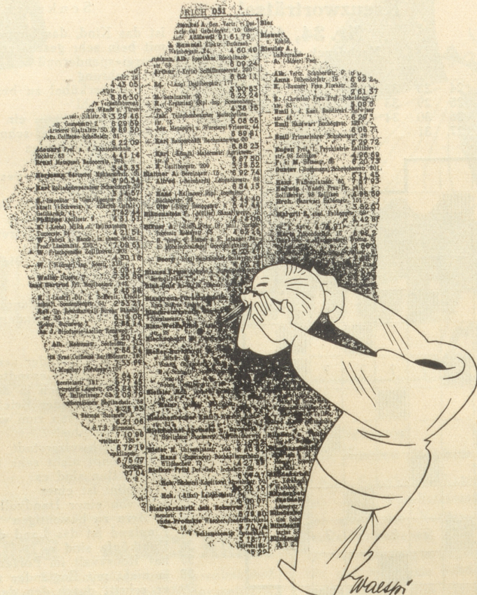
Das neue übersichtliche Telefonbuch: