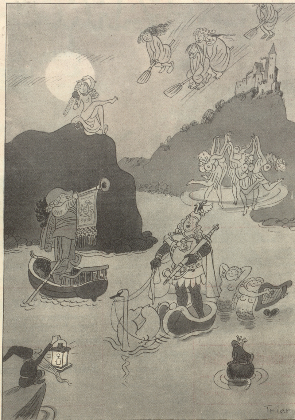
Der Rhein in der Romantik