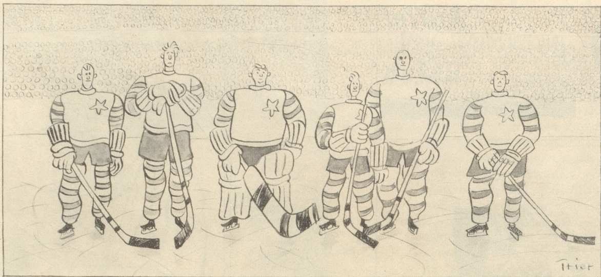
Die Helden in der Arena