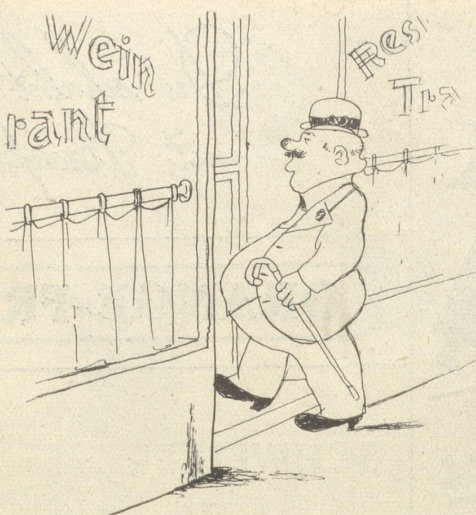
wo der Schlemmerli nicht vorbeigehen kann