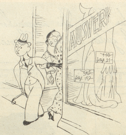
Wo die Gattin nicht vorbeigehen kann