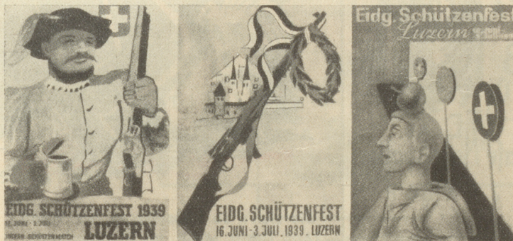
Die erstprämiierten Entwürfe für das Plakat des Eidg. Schützenfestes und Internationalen Schützenmatches in Luzern

Aus «New Zealand Review», übersetzt in der «Auslese».