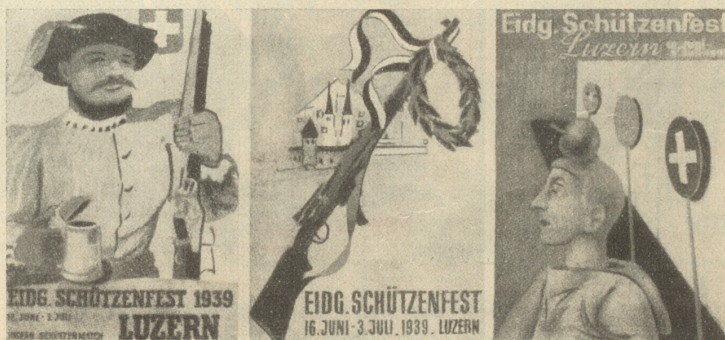
Die erstprämiierten Entwürfe für das Plakat des Eidg. Schützenfestes und Internationalen Schützenmatches in Luzern

Aus «New Zealand Review», übersetzt in der «Auslese».