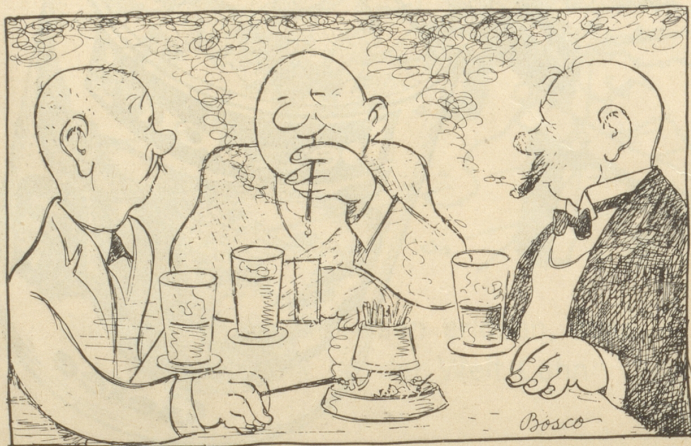
Ein Ausländer: Liebe Eidgenosse, ihr seid z'beneide, ihr habt 's reinst Paradiesle!