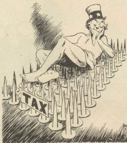
Hat es Amerika besser?

Glosse aus der New-York-Times über die neuen Steuern.