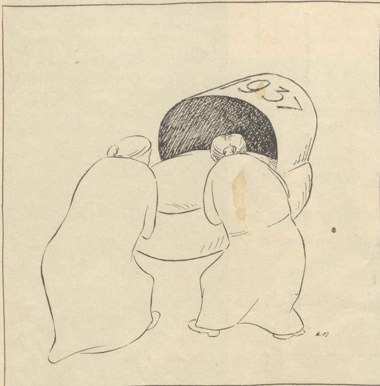
Lueg, lueg — uf ond neder de Alt!