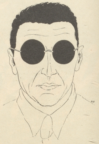
„Ich habe verdunkelt - bin sonst blond!“

Alle verheirateten Frauen, die von ihrem