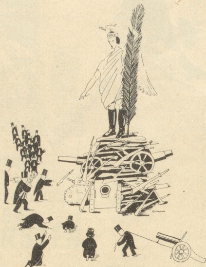
Me sött de Friedensängel zum Diktator befördere!