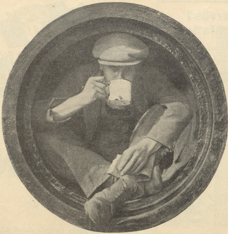
DER MODERNE DIOGENES

Was trinkt er wohl? Natürlich Ovomaltine!