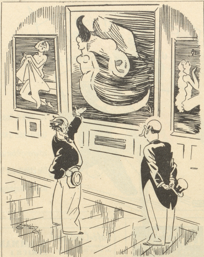
«Die Idioten! ... haben mein Selbstportrait verkehrt aufgehängt!»