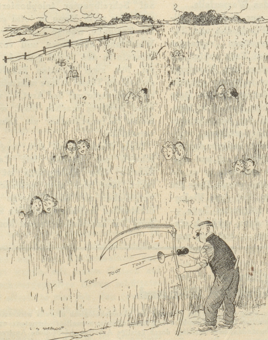
Eine neue landwirtschaftliche Erfindung