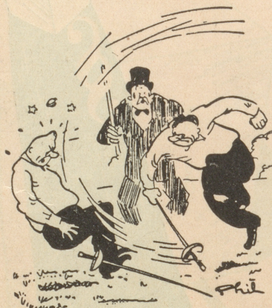
Beim Duell «Halt! Das ist gegen das Reglemang!» Ric et Rac

... dass nämli zu unserem Bild-Ideen-Wettbewerb nur 3 (in Worten: drei) gute Beiträge eingehen. Wir verlängern den Einsende-Termin bis 21. Juli (21 = 3 mal 7). Wettbewerbs-Bedingungen siehe ohne Ausnahme Seite 19. Bö und Beau.