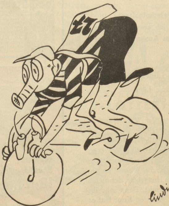
Ein Bildchen von der nächsten Tour de Suisse

Er hat zwei harbe Rappen Sein Zeugerl steht am Graben,