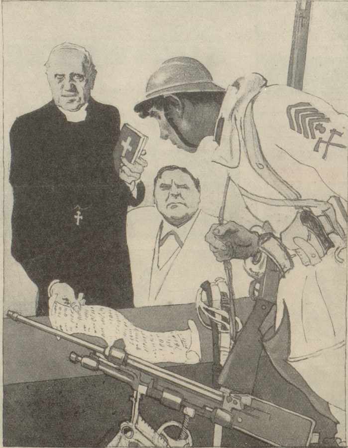
„Ein gutes Gewissen ist ein sanftes Ruhémittel! Wenn du deine Schulden bezahlst, stoff alles für Rüstungen auszugeben, wirst du dich gleich wieder sicher fühlen.“

Frankreich und der amerikanische Gläubiger (E. Thöny)