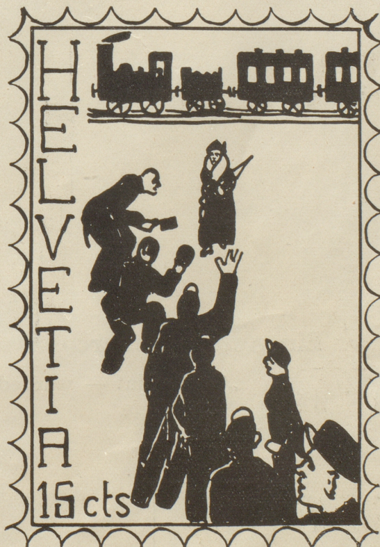
Empfang der Fremden