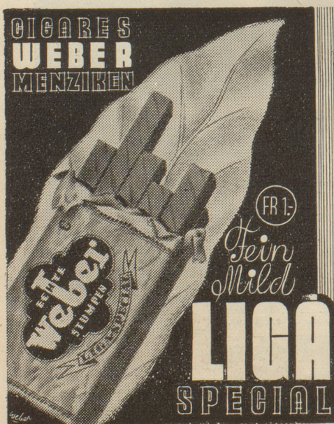
Weber-Stumpfen sind einzigartig!

Der hohe Uebnahmepreis durch den Bund hatte zur Folge, dass es vielen Bauern rentabel war, ihr Tafelobst zu brennen. Die Revision des Alkoholgesetzes wird vor allem den Uebnahmepreis so festzusetzen haben, dass solcher Unfug nicht mehr rentiert. Der Bauer hat sonst gar kein Interesse zum Tafelobstbau überzugehen. (Das schon im ersten Gesetz berücksichtigt zu haben, hätte dem Scharfsinn der Verfasser sehr zur Ehre gereicht!)