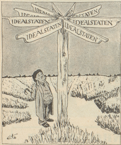
Der Wegweiser nach Idealstaat von den verschiedenen Parteien gemeinsam gestiftet (Söndagsnisse Strix, Stockholm)