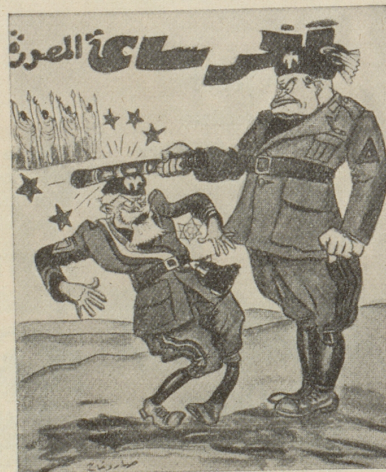
Mussolini überreicht General de Bono den Marschallstab