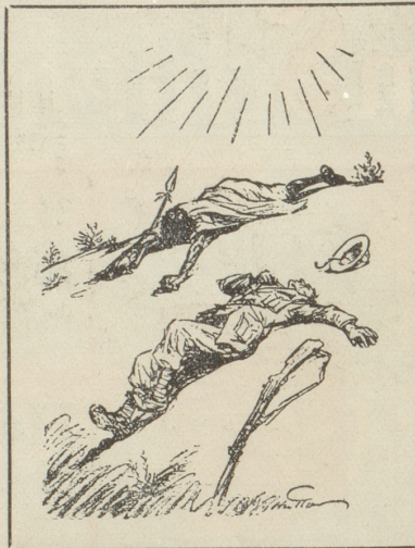
Der Platz an der Sonne