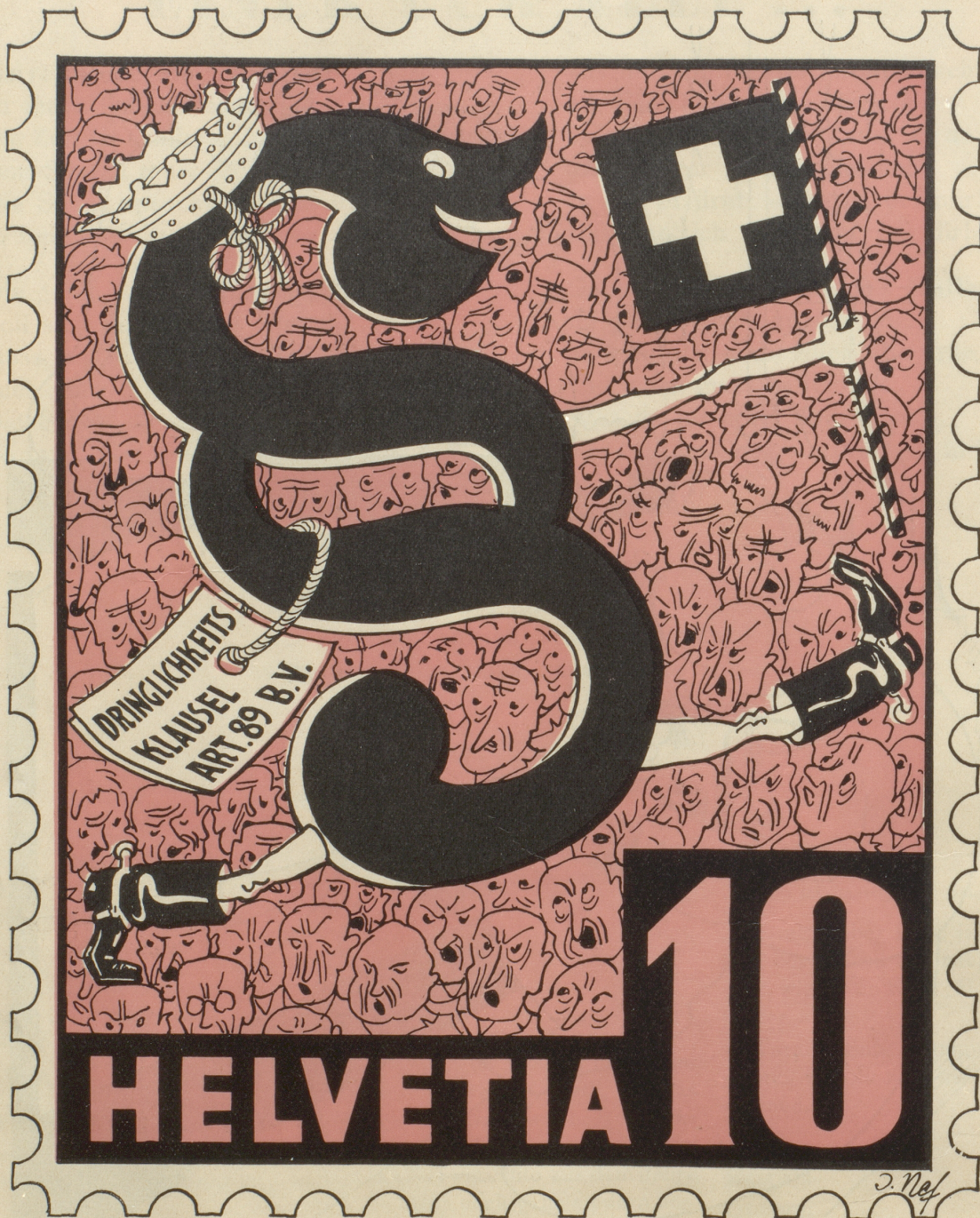
Aus der Serie: Neue Schweizer Briefmarken

Golden g id BIERE sind wolfsmunde und bekönnlich