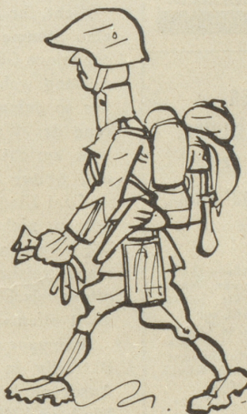
14) Her mit dem Tornisterli: sind au e chli Soldate!!