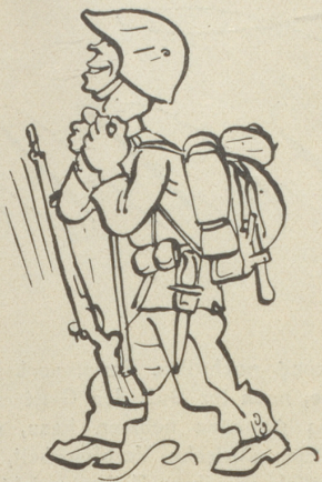
8) Befehl: Kragen öffnen!