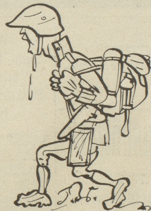
15) Und nomal der mit dem Tornisterli: Anhalten! - rechts treten — Säcke abnehmen, Gwehre zusammen!!!

in Kairo wäre, wie es die Zeitungen meldeten, würde Holmes nicht auf unserm Schiff Spuren finden.»