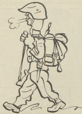
11) Guet, mached d'Hättli uf und dr oberscht Chnopi!