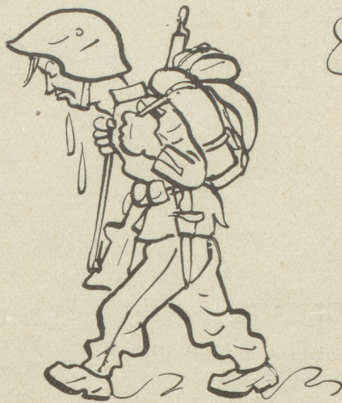
9) Füsilier Höppli ..... schlechte Kopfhaltung ... Kragen schliessen!