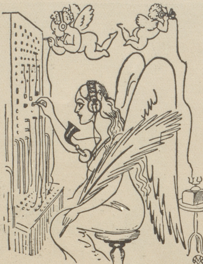
Die Verbindung mit Spanien scheint irgendwie defekt!