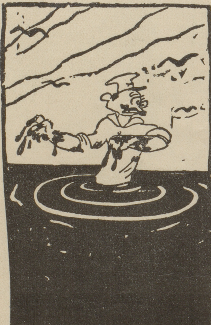
Das Blutbad «Hilfe! Ich ertrinke!»