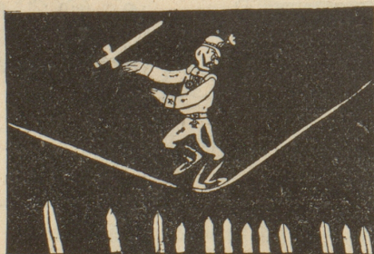
Ein gefährlicher Seiltanz