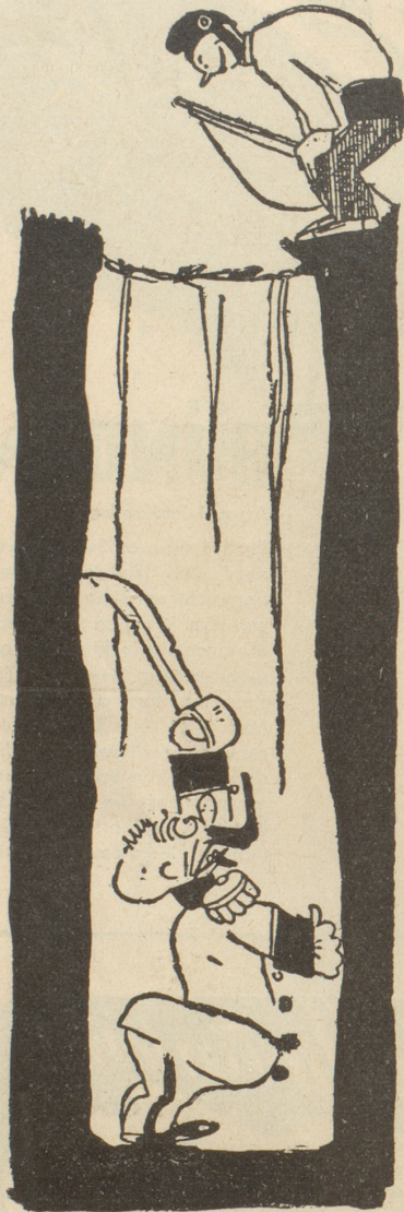
Der General: «Wenn Du mich sofort herauslässt, dann will ich Gnade für Recht ergehen lassen!»