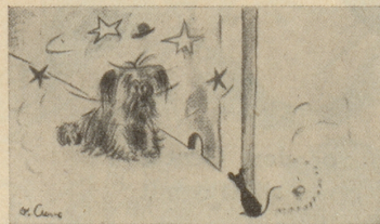
Swift auf der Mäusejagd