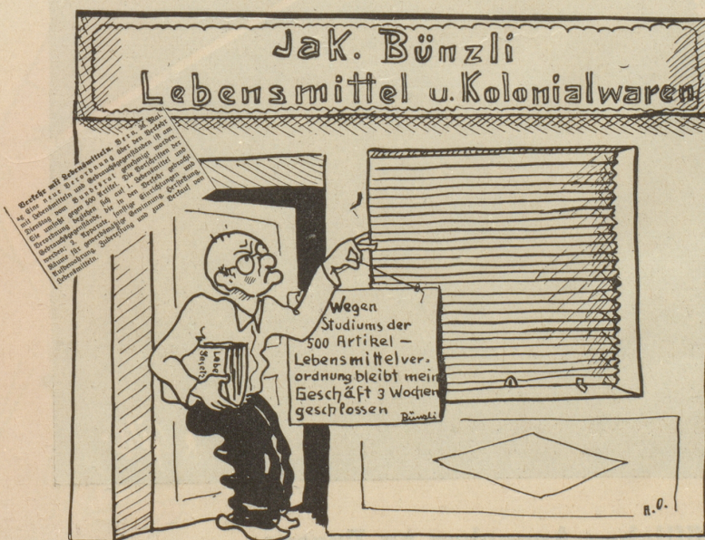
Tragische Folgen einer bundesrätlichen Verordnung.