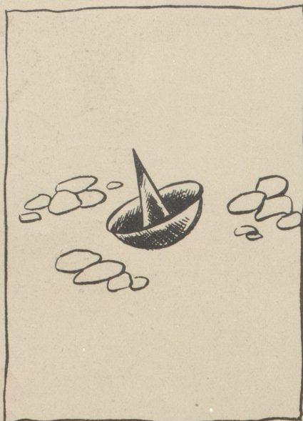
Der öffentliche Velofeind No. 1

«Jawohl aufgehoben, Bedauere, aber Sie können morgen nicht mehr weiterfahren. Reglement. Sie sind nun aus dem Rennen genommen. Gehen Sie jetzt ins Hotel, pflegen Sie sich, schlafen Sie sich die Müdigkeit aus den Knochen und morgen fahren Sie dann hübscheli heim.»