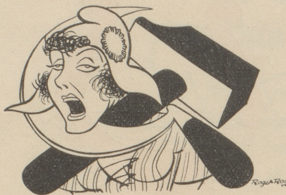
Frankreichs neuer Halsschmuck Le dernier cri de Paris