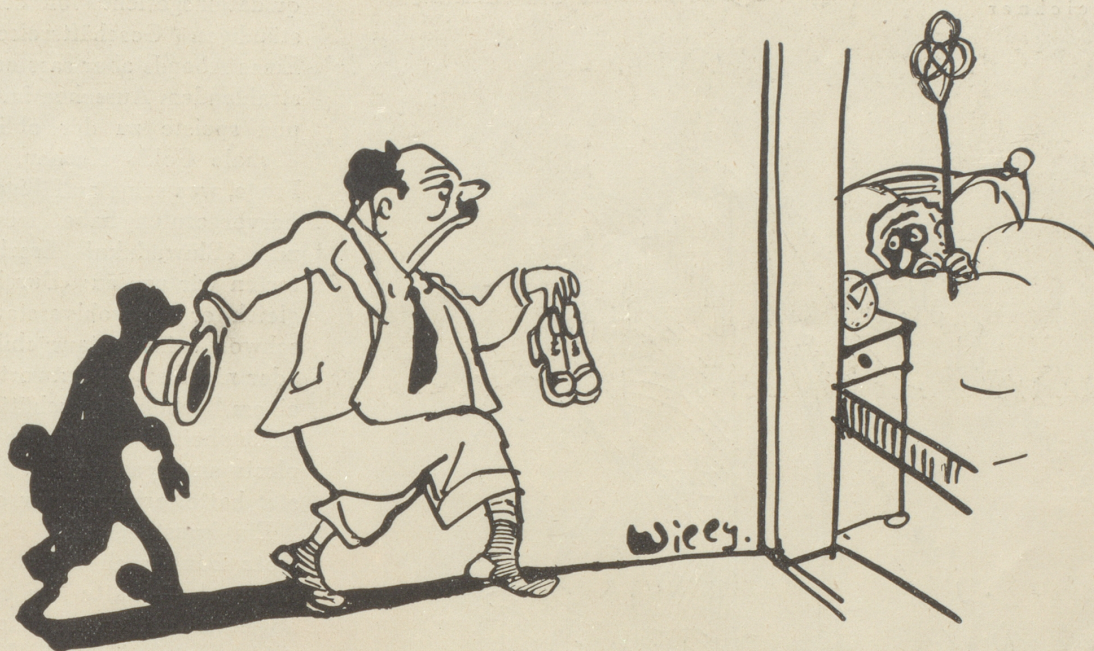
Der Diktator kehrt von der Diktatorenversammlung nach Hause zurück