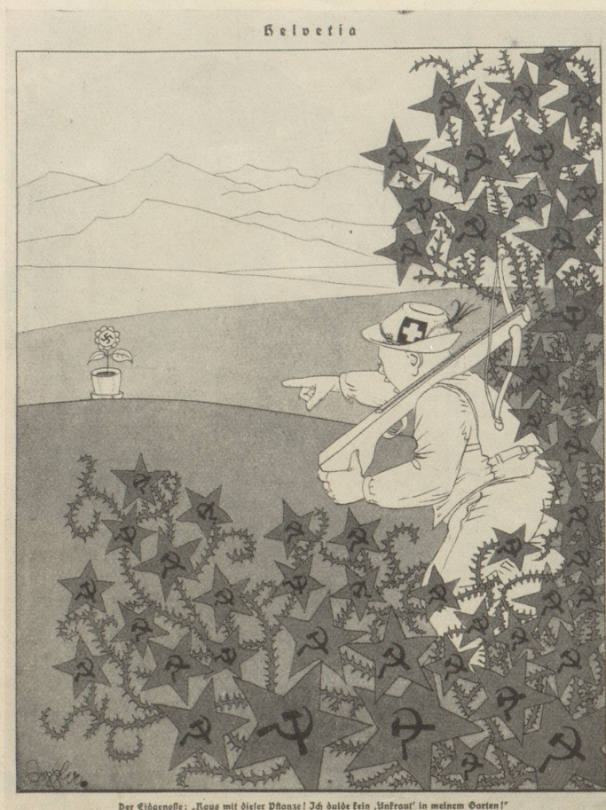
Der Eidgenosse: „Kous mit dieser Pflanze! Ich dütde kein „Unfräut“ in meinem Garten!“