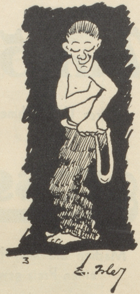
— i tue's wieder undere!