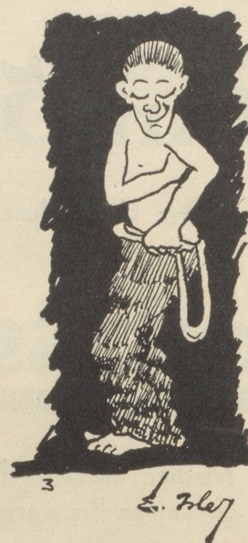
— i tue's wieder undere!