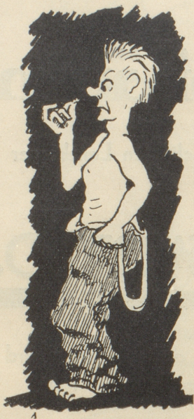
Au — da hani es Wänzli!