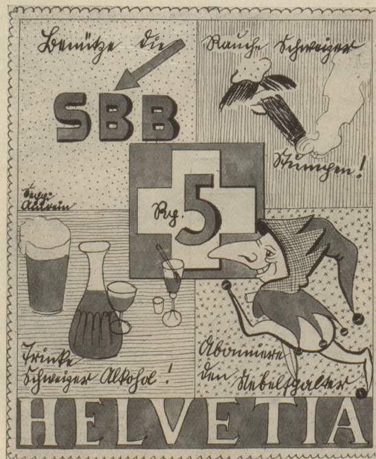
Aus der Serie: Neue Schweizer Briefmarken