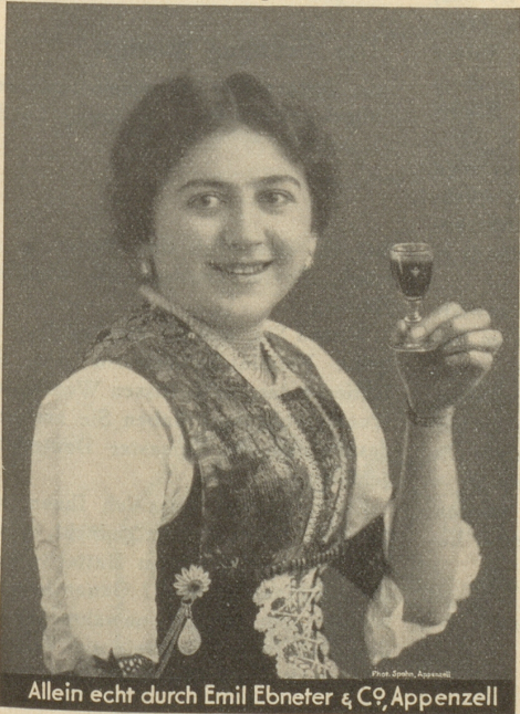
Allein echt durch Emil Ebnetter & Co, Appenzell

Nicht irgend ein Bitter sondern Appenzeller Alpenbitter