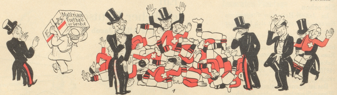
Das «Fussballmaterial» wird gesammelt.