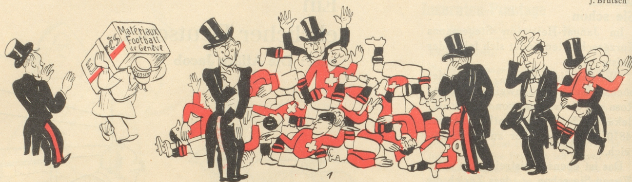
Das «Fussballmaterial» wird gesammelt.