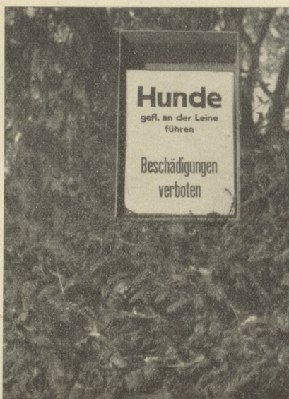
Die guten Zeiten, wo Beschädigungen noch gestattet waren, scheinen endgültig passé!

Wenn ein Rüstungsfanatiker ent-rüstet ist! Jpe